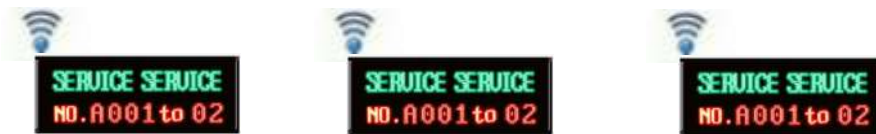
MINI AFFICHAGE LED COMPTEUR SANS FIL