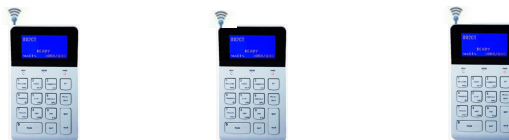
CLAVIER SANS FIL